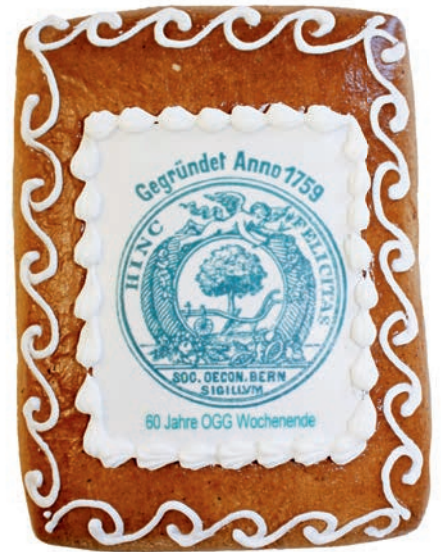
Zum 60-jährigen Jubiläum des Meielisalp-Wochenendes

Auf das nächste Meielisalp-Wochenende vom 12./13. November 2016 freuen wir uns bereits heute.