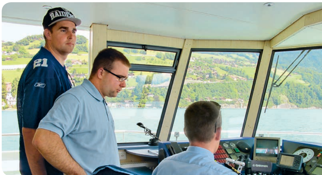
Anlässlich des letzten Gästefestes auf dem Thunersee, Foto OGG

Im Namen des BWF-Teams bedanken wir uns herzlich bei allen Gästen und Gastfamilien, bei den Behördenvertretern, Beiständen und Angehörigen für die engagierte und vertrauensvolle Zusammenarbeit. Ein herzlicher Dank gebührt auch den Vorstandsmitgliedern der OGG, die uns mit ihrem verantwortungsvollen Einsatz eine spannende Arbeit in einem vielseitigen und herausfordernden Arbeitsumfeld ermöglichen. ■