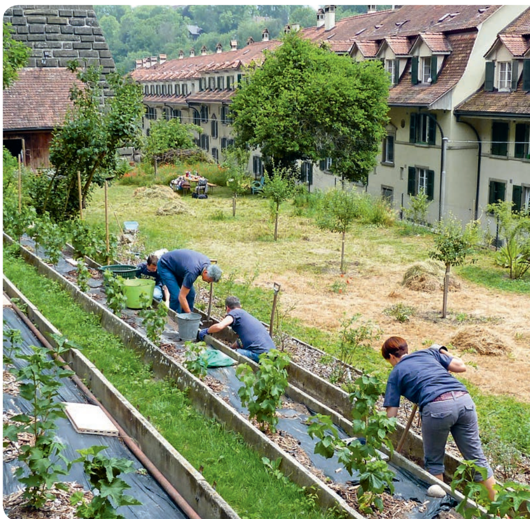
Freiwilligeneinsatz im Stiftsgarten Bern

In der Folge unterstützte die OGG Angela Losert bei der Gestaltung und Planung eines Gewächshauses für den Betrieb der Anlage und für die Verarbeitung der Gartenprodukte. Ebenso wurden die ersten gemeinsamen Anlässe angedacht. Die Umsetzung der geplanten Infrastruktur und der Beginn eines regelmässigen Angebots für die Öffentlichkeit werden voraussichtlich 2016 erfolgen. ■