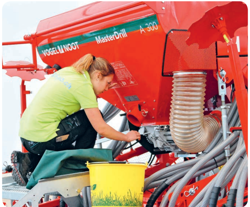
Junge Berufsleute aus der Landwirtschaft beteiligten sich erstmals an den SwissSkills

Die Ausbildung junger Menschen, welche sich motiviert und aus Überzeugung mit bestem Fachwissen tagtäglich in der Landwirtschaft engagieren, ist und bleibt ein wichtiges Anliegen der OGG. Deshalb wurde der Anlass von der OGG im Rahmen eines Co-Sponsorings finanziell unterstützt. ■