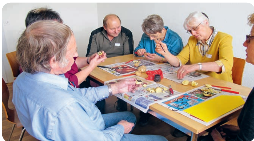
BWF-Gastfamilien an einer Gruppenarbeit