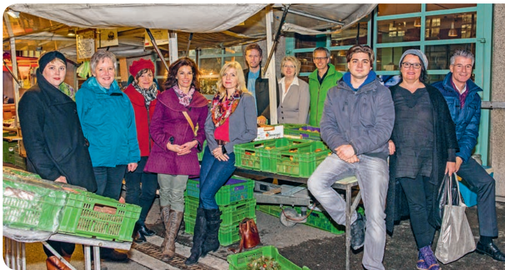
Das engagierte Projektteam des Kochbuchs «Restenlos glücklich»

Die Äss-Bar konnte auf einem erprobten Geschäftsmodell der Äss-Bar in Zürich aufgebaut werden. Hinter dem Erfolg stehen aber auch ganz viel Herzblut und unzählige Arbeitsstunden der Berner Partner und des Ladenteams. ■