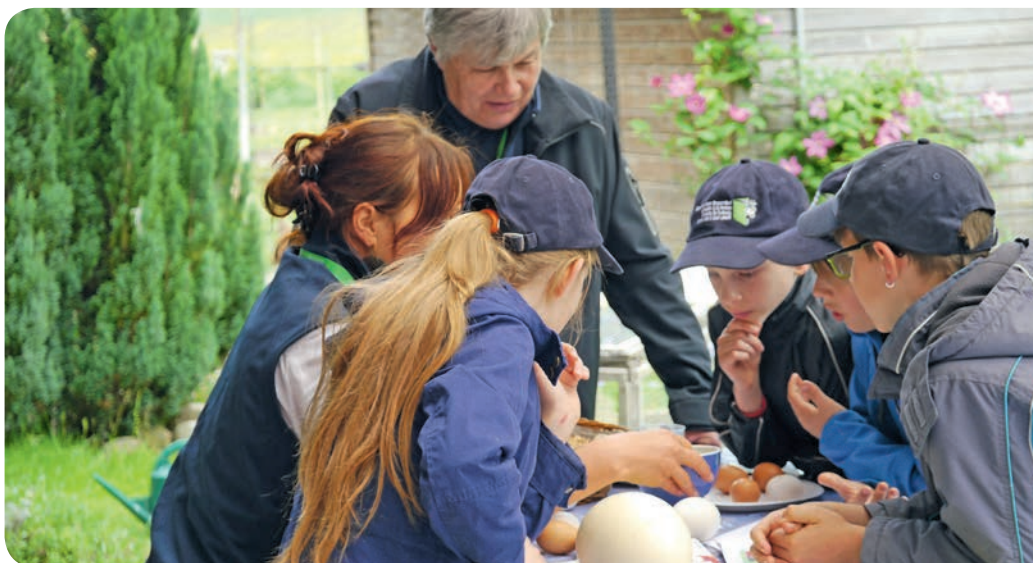
Schule auf dem Bauernhof