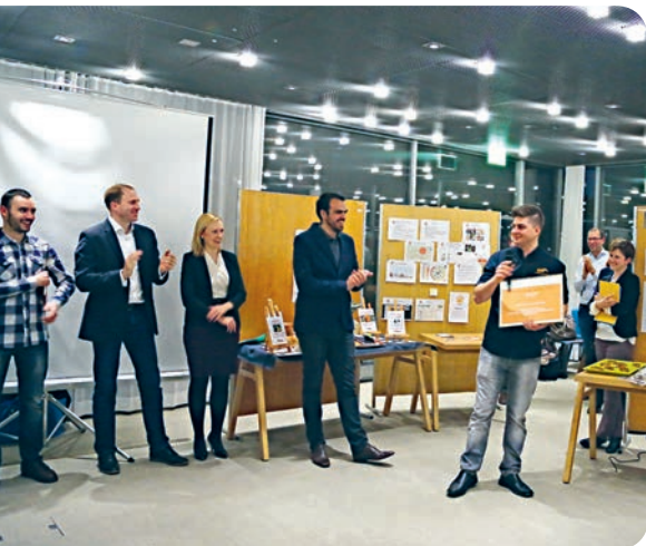
Anlässlich der Preisverleihung 2015

Das Start-up-Programm «Our Common Food» organisierte im März 2015 einen Event rund um den OGG Award. Innovative Unternehmer präsentierten ihre Geschäftsideen, die unser Ernährungssystem nachhaltiger gestalten sollen. Die OGG leistete einen wichtigen finanziellen Beitrag an die Durchführung dieses Anlasses und stiftete das Preisgeld des Wettbewerbes.