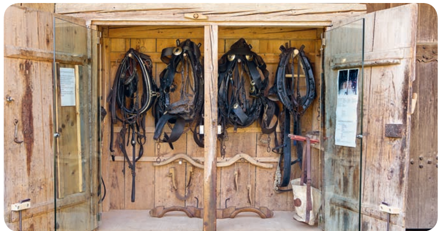
Der zur Vitrine umgebaute Kummetschrank, Foto zVg

Ernst Roth Stiftungsrat Bauernmuseum Althaus Jerisberghof