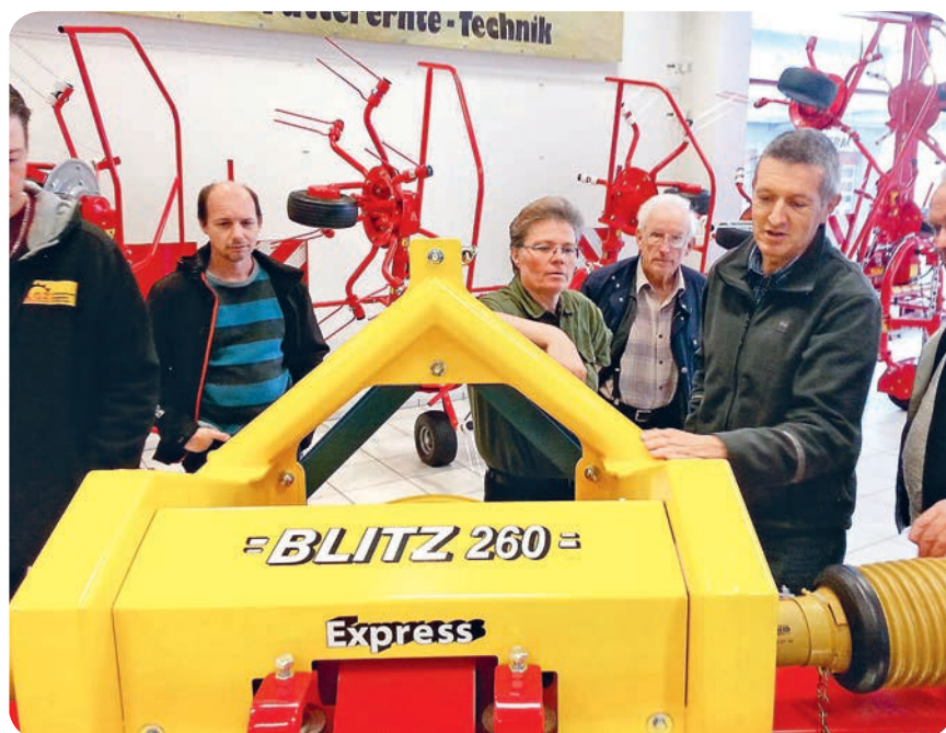
Besichtigung der Rigitrac Traktorenbau AG