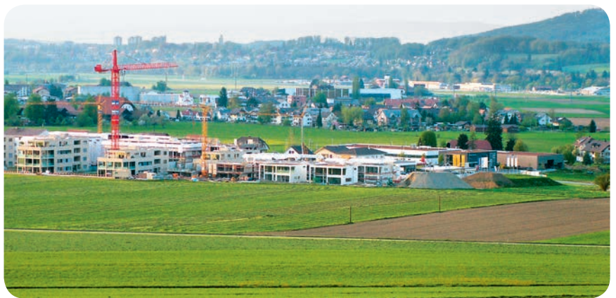
Die Berner Kulturland-Initiative soll das Kulturland besser schützen

2016 folgen die Behandlung im Grossen Rat und möglicherweise die Volksabstimmung. Unabhängig vom Ausgang des politischen Ergebnisses bleibt der Schutz des Kulturlandes eine gesellschaftliche Herausforderung, deren Bearbeitung zu den Stossrichtungen der OGG gehört. ■