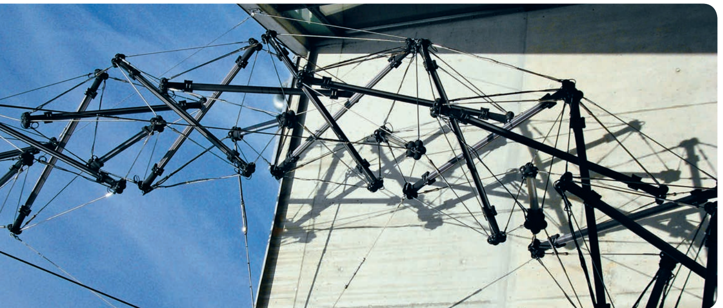
Seilerei Jakob

Im Frühsommer traf sich der Beirat AUeL zu einer Standortbesprechung. Im Beirat sind alle Organisationen vertreten, die beim Aufbau der Anlaufstelle aktiv mitgeholfen haben und diese Stelle nun auch weiterhin unterstützen und ideell tragen. Im nächsten Jahr soll eine neu zu bildende Arbeitsgruppe das Angebot der AUeL analysieren und weiterentwickeln sowie Lösungen für die personellen Engpässe, besonders auf der Ebene der Kontaktpersonen, finden. ■