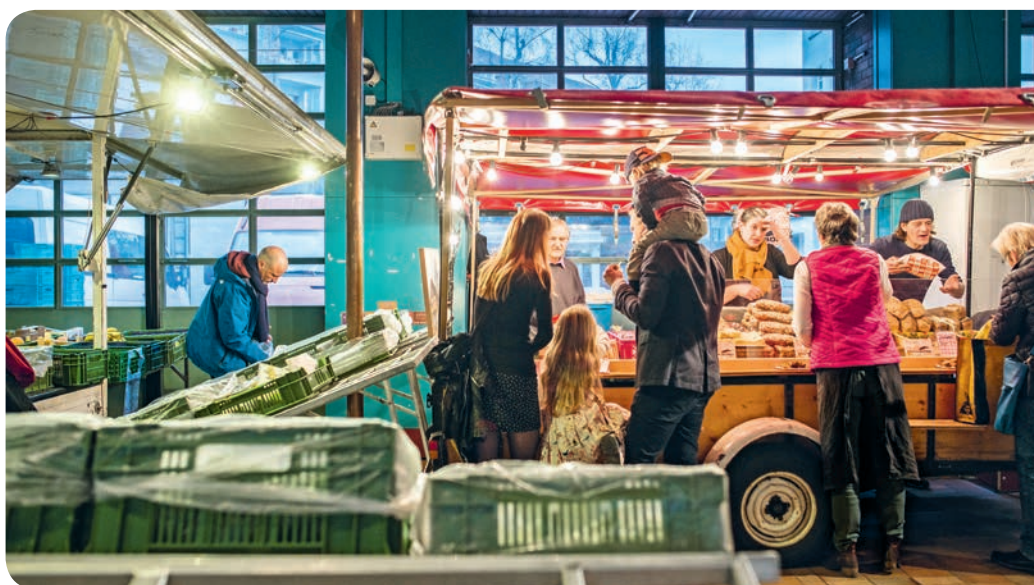
Qualitätsprodukte aus der Region prägen den Abendmarkt Allmend, Foto Franziska Rothenbühler

Doch auf den hundert Allmend-Quadratmetern der alten Feuerwehrkaserne Viktoria, die sich zwischen der Kaffeerösterei Adrianos und der Kaffee-Bar Löscher befinden, soll auch ein Raum für junge, experimentelle Gastronomen oder Anlässe sein, die sich den oben genannten Zielen verschrieben haben. ■