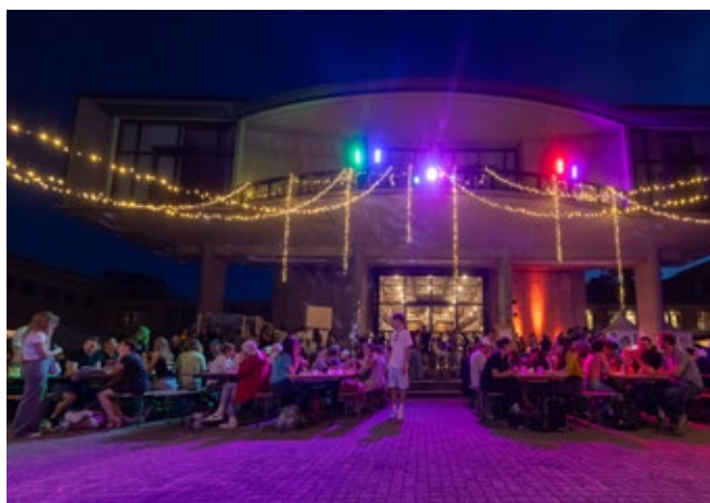
Foodsave-Bankett in Freiburg

Mit dem Projekt «MHD+ im Detailhandel» unterstützt foodwaste.ch Läden in der ganzen Schweiz beim Verkauf von Lebensmitteln über das Haltbarkeitsdatum hinaus. In diesem Jahr wurden mehr als 200 Starter-Sets an Läden abgegeben, die Kantone Jura, Genf und Wallis wurden Projektpartner und 300 Interessierte nahmen an Webinaren zum verlängerten Verkauf teil. Die Nachfrage nimmt spürbar zu.