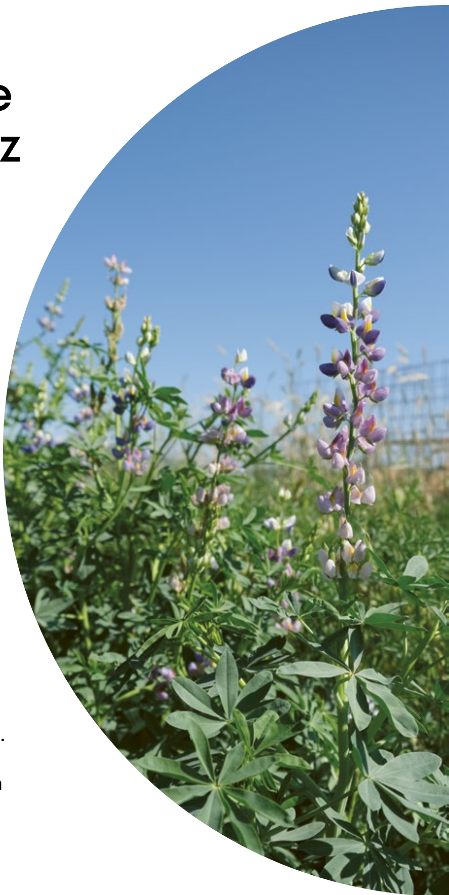
Lupinen in voller Blüte auf dem Weltacker Bern

Die OGG Bern erzielt 2025 ein Jahresergebnis von CHF 46'816. Mit dem Wachstum der Geschäftsstelle ist auch deren Aufwand gestiegen. Trotzdem darf die finanzielle Lage als gesund bezeichnet werden.