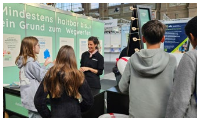
Ausstellungsauftritt foodwaste.ch

In Referaten und Workshops erfuhren unterschiedliche Gruppen Wissenswertes über Food Waste. In verschiedenen Kochevents des Projekts Null-Resten-Küche wurde es zudem praktisch: Studierende, Arbeitsteams und andere Interessierte lernten, wie sie durch Einmachen oder Resteverwertung Food Waste reduzieren können. Oder sie zauberten Gourmetmenüs aus Liegegebliebenem bei den Foodsave-Kitchen-Challenges. 15 Ausstellungsauftritte von foodwaste.ch gaben dem Thema Food Waste Sichtbarkeit in der Bevölkerung. Knapp 5000 Personen, darunter viele Schüler:innen, lernten hier spielerisch, was sie gegen Food Waste im Haushalt tun können.