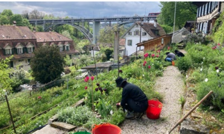
Frühlingshafte Tulpenpracht im Stiftsgarten

Durch eine Installation der Künstlerin Katharina Cibulka an der Münsterplattform-Mauer erlangte der Garten internationale Aufmerksamkeit. Die Restaurierungsarbeiten an der Mauer erschwerten den Zugang zum Stiftsgarten zeitweise, trotzdem zählten wir insgesamt rund 1770 Besucher:innen – plus Schulklassen und GartenHerzMenschen.