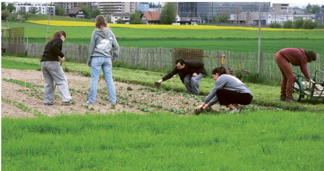
Gymnasium Lerbermatt auf dem Weltacker Bern

Apropos Berufslehre: Besonders gefreut hat uns 2025, dass wir immer wieder Berufsschulklassen der angehenden Landwirt:innen auf dem Weltacker empfangen durften. Damit schliesst sich ein Kreis, denn es war die OGG Bern, die Mitte des 20. Jahrhunderts im Auftrag des Kantons die bäuerliche Berufslehre aufgebaut hat.