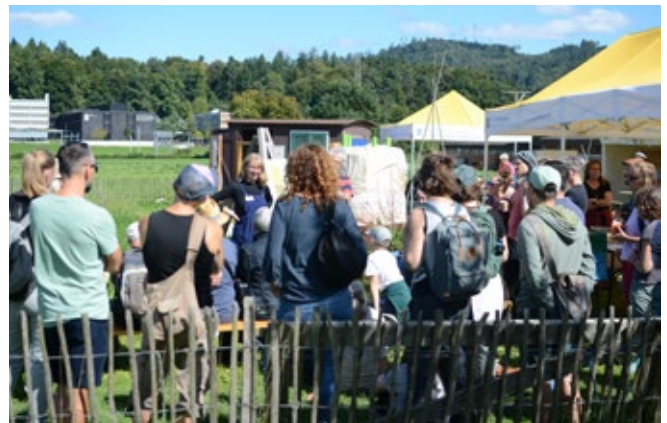
Erntefest Weltacker Bern 2025

Das Erntefest war der krönende Abschluss der Acker-saison. Dank einem gut harmonierenden, resilienten Team und verlässlichen, kreativen Partnerinnen und Partnern konnten wir auf viele Erfolge zurückblicken.