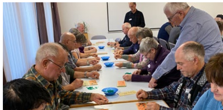
Konzentrierte Gesichter beim Lottospiel