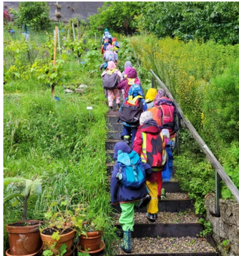
Kindergarten zu Besuch im Stiftsgarten

Der Austausch mit der Berner Bildungslandschaft fand auf vielen Ebenen statt. So führte der Verein ProEdu eine Vorstandssitzung sowie eine Weiterbildung bei uns durch. Die Mitglieder des Vereins Bildungs- und Schulgärten Schweiz trafen sich an einem warmen Spätsommernachmittag bei uns zu ihrer Jahresversammlung. An den Berner Bildungstagen in Biel sowie in Bern war der Stiftsgarten gemeinsam mit dem Weltacker Bern präsent. Der Rückblick zeigt, wie wichtig und wertvoll für unsere Arbeit die Synergien mit den anderen Angeboten der OGG Bern, aber auch mit partnerschaftlich verbundenen Organisationen sind.