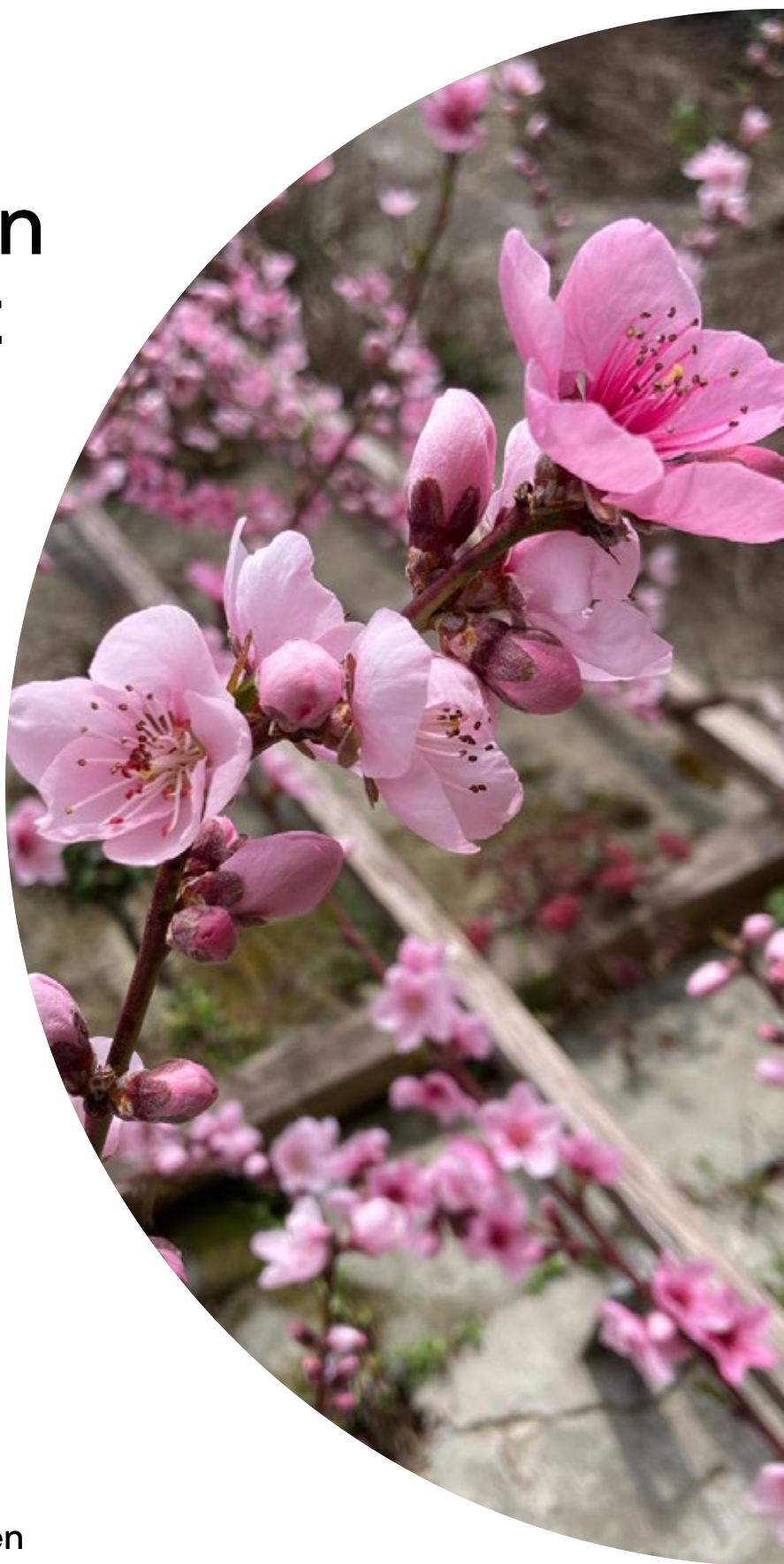
Roter Weinbergpfirsich ( Prunus persica ) im Stiftsgarten Bern

2025 stand im Zeichen von Vertiefung, Weiterentwicklung und Zusammenarbeit. In allen Tätigkeitsbereichen wurde Bestehendes weiterentwickelt, neue Impulse wurden aufgenommen und Bildungs- sowie Begegnungsräume gestärkt. Gemeinsam mit Partner:innen, Freiwilligen und Teilnehmenden konnte die OGG Bern ihre Angebote wirkungsvoll umsetzen und weiter verankern.