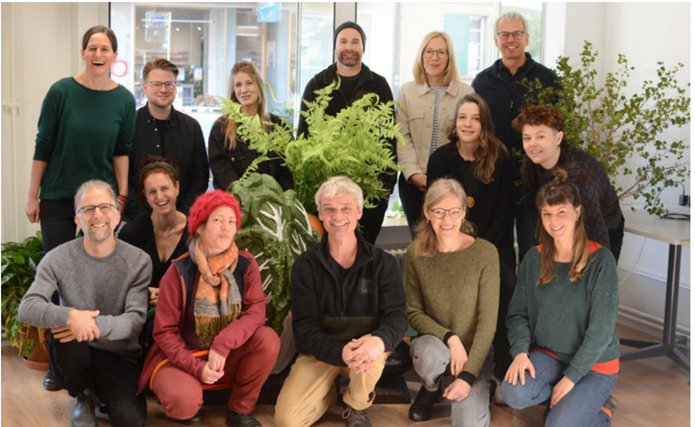
Teamfoto Geschäftsstelle per 1.1.2026