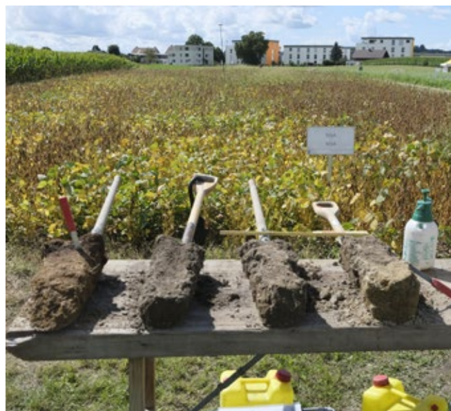
Spatenproben beim Oberacker-Jubiläum

Hinter der Veranstaltungsreihe stand die Trägerschaft «Brennpunkt Boden» mit der BFH-HAFL, dem INFORAMA, der Fachstelle Boden des Kantons Bern, Swiss No-Till und neu seit 2025 der OGG Bern. Am 16. September luden die fünf Organisationen zur Folgeveranstaltung mit Begutachtung der Ergebnisse der Maschinendemo. Die Unterschiede zwischen den Saatstreifen waren augenscheinlich – manche Saatstreifen waren komplett grün geworden, andere eher braun geblieben, bei den einen war der Kleeanteil