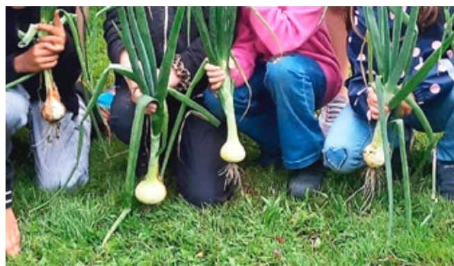
Zwiebelernte Gemüsetruhe Schule Hard Langenthal

Zum Jahresausklang bot eine Online-Infoveranstaltung neuen Interessierten die Möglichkeit, das Angebot kennenzulernen. Die zahlreichen positiven Stimmen zeigen, wie stark das Projekt gärtnerisch und sozial wirkt und wie vielfältig die Gemüsetruhen genutzt werden. Auch die Zahlen unterstreichen unsere Wirkung: Im gesamten Jahr haben rund 1300 Kinder und 200 Erwachsene mit unseren Truhen gegärtnert.