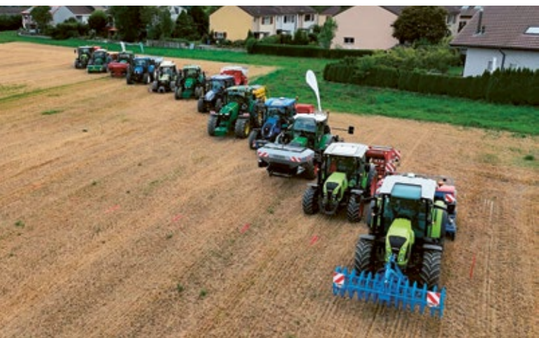
Maschinendemo auf der Rütli in Zollikofen

Zwölf unterschiedliche Sämaschinen und eine Drohne waren am 5. August auf der Rütli in Zollikofen unterwegs. Jede dieser Maschinen legte einen Streifen Gründüngung an. Viele der rund 200 Gäste prüften danach direkt auf dem Feld, wie die Oberfläche des Bodens auf den verschiedenen Streifen aussah. Die Diskussionen wurden beim anschliessenden Imbiss, den die OGG Bern offeriert hatte, lebhaft weitergeführt.