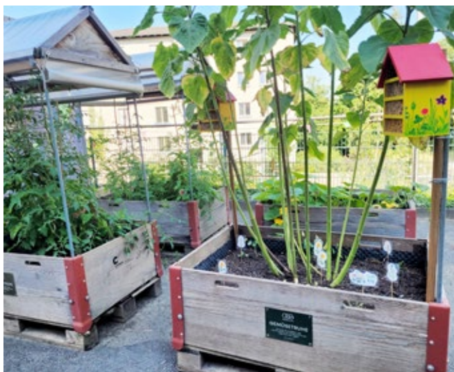
Gemüsetruhe Kita Inselspital, Bern

Von Langenthal über Biel bis Wengen sorgten die OGG-Gemüsetruhen für positive gärtnerische, kulinarische und gemeinschaftliche Erlebnisse. Nebst vielen Schulen nahm erstmals auch ein Asylzentrum das Angebot in Anspruch.