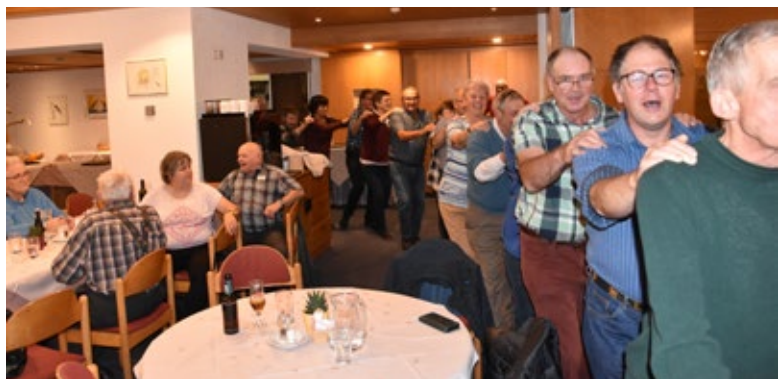
Ausgelassene Stimmung nach dem Abendessen

Das nächste OGG Meielisalp-Wochenende findet am 7. und 8. November 2026 statt.