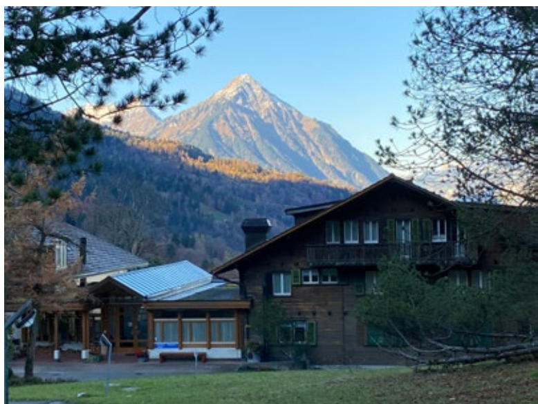
Schöne Stimmung auf der Meielisalp