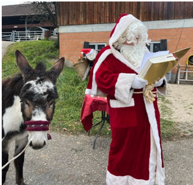
Gemeinsamer Samichlaus-Anlass

Der regelmässige Austausch unter den Gastfamilien blieb ein wichtiger Bestandteil der Arbeit. In Regiogruppen teilen sie Erfahrungen, entwickeln gemeinsam Lösungen und stärken die Qualität ihrer Betreuungsarbeit. Die Arbeit der WoBe AG fand 2025 auch über den eigenen Wirkungskreis hinaus Beachtung – fachlich wie politisch. Das betreute Wohnen in Familien überzeugt, weil es Nähe organisiert und Alltag in familiären Strukturen ermöglicht.