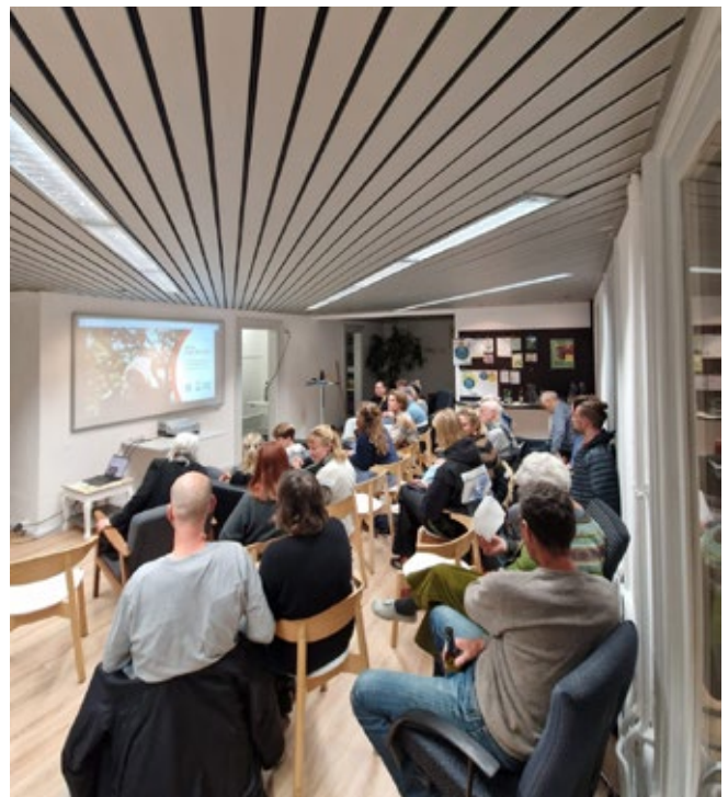
Filmabend «The Pickers» an der Gesellschaftsstrasse 22

Highlights waren auch die Begegnungen und Gespräche zwischen urbaner Bevölkerung und landwirtschaftlich tätigen Menschen. Die Themen reichten von der Haselnussproduktion über solidarische Landwirtschaft bis zu schonender Bodenbearbeitung.