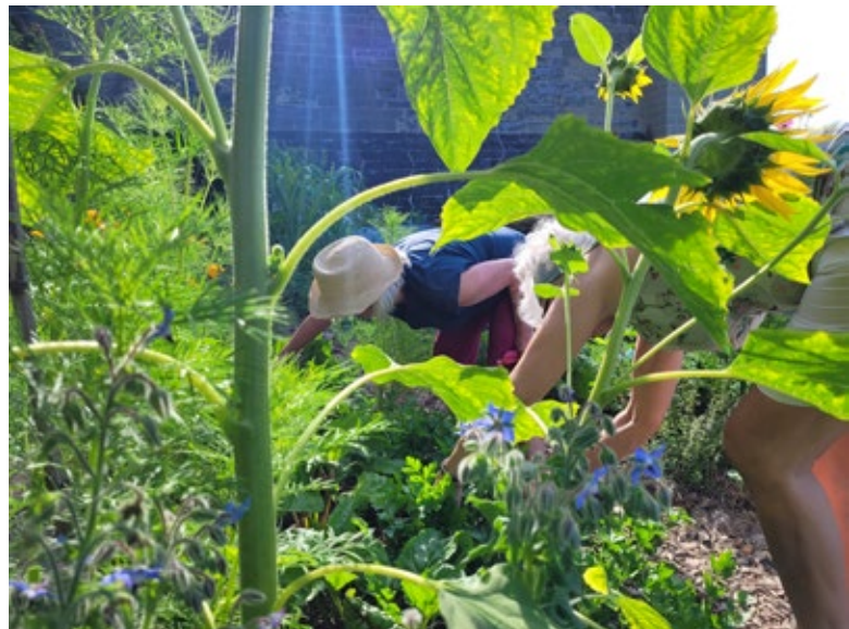
Fleissige GartenHerzMenschen im Stiftsgarten

Besonders grosse Freude machte die Arbeit mit den Freiwilligen. Als Gemeinschaftswerk pflegen wir den Garten und legen so die Grundlage für ein breites Programm rund um Biodiversität und Bildung. Nebst den GartenHerzMenschen, die uns regelmässig wertvolle Unterstützung bieten, besuchten uns auch 42 Mitarbeitende einer grossen Firma im Rahmen von Corporate Volunteering mit intensiven Garteneinsätzen.