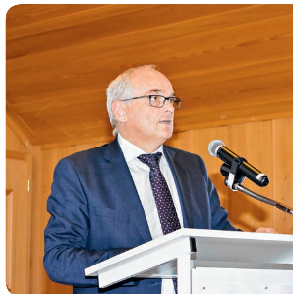
... Regierungsrat Pierre Alain Schnegg, Vorsteher der Bernischen Gesundheits- und Fürsorgedirektion.