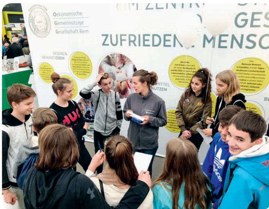
BEA 2018: Eine Schulklasse erhält am OGG-Stand Informationen zur Food-Waste-Ausstellung.

Im ersten Halbjahr fanden zwei Foodpreneure-Veranstaltungen statt. Nach der Sommerpause lag der Schwerpunkt auf dem Netzwerk für eine nachhaltige Ernährung Bern (siehe weiter oben). Eine Einbindung der Foodpreneure in diese Plattform wird 2019 geprüft.