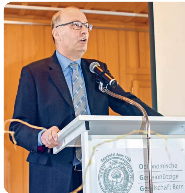
An der Mitgliederversammlung 2018: Nationalrat Markus Ritter, Präsident des Schweizer Bauernverbandes und ...