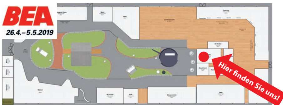
Der OGG-Stand an der BEA 2019 befindet sich im hinteren Teil des Grünen Zentrums (Halle 11).

Bereits mehrfach haben Sie über den Stiftsgarten am Fuss des Berner Münsters lesen können. Nun lädt Sie die Stiftsgarten GmbH zu einer Führung ein, bei der Sie diese Oase mit ihrer Beerenproduktion und dem bunten Angebot rund um die Themen Gärtnern, Biodiversität und gesunde Ernährung direkt erleben und geniessen können. Angeboten wird der Anlass exklusiv für OGG-Mitglieder am Samstag, 15. Juni 2019, 14.00 bis 15.00 Uhr, und am Montag, 9. September 2019, 18.00 bis 19.00 Uhr. Jeweils mit anschliessendem Apéro. Anmeldung bis eine Woche vorher an