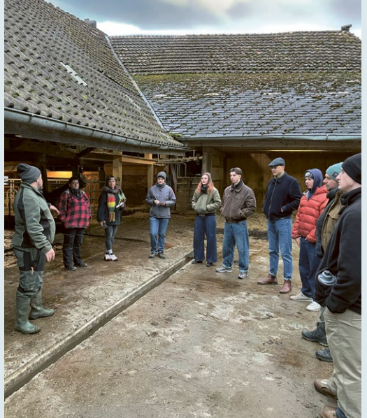
Eine Hoftötung mitzuerleben, war für die Teilnehmenden bewegend.

Das weitere Programm fand in der Coworking Küche Bern statt. Am Nachmittag gab