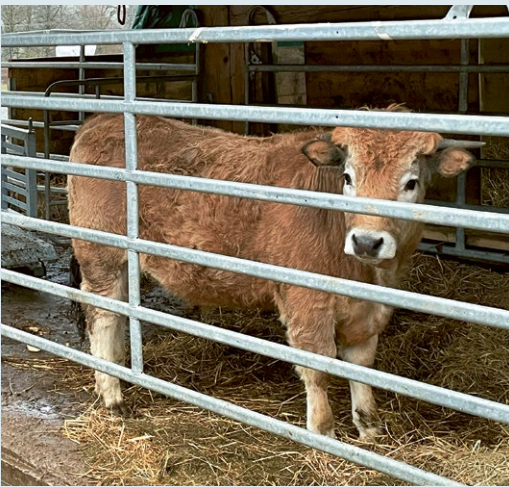
Escobars Leben fand auf seinem Hof ein respektvolles Ende.

Wie gelingt verantwortungsvoller Fleischkonsum? Diese Frage beschäftigt Landwirtschaft, Gastronomie und Gesellschaft gleichermaßen. Der Anlass «Stressfreier Fleischgenuss» des RegioFood Hub zeigte, dass die Landwirtschaft Tierwohl und Qualität bieten kann – wenn die Nachfrage vorhanden ist.