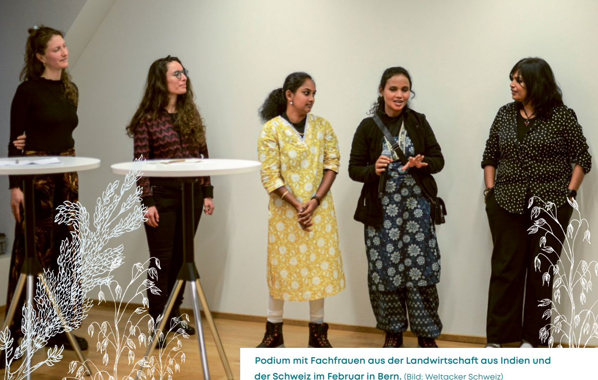
Podium mit Fachfrauen aus der Landwirtschaft aus Indien und der Schweiz im Februar in Bern.

Ein Drittel der landwirtschaftlichen Angestellten in der Schweiz ist weiblich. Aber der Anteil Betriebsleiterinnen liegt bei weniger als acht Prozent. Das passt zum globalen Bild: Die Arbeit der Frauen in der Landwirtschaft ist weniger gut sichtbar, mit weniger Ansehen verbunden und weniger gut entlohnt als diejenige der Männer. Um das zu ändern, hat die Welternährungsorganisation (FAO) 2026 zum «International Year of the Woman Farmer» erklärt.